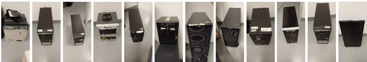
D32410000 D00003809 D00003772 D40690000 D33270000 D33640000 D33280000 D34170000 D39140000 D33540000 D00003797 D57790000