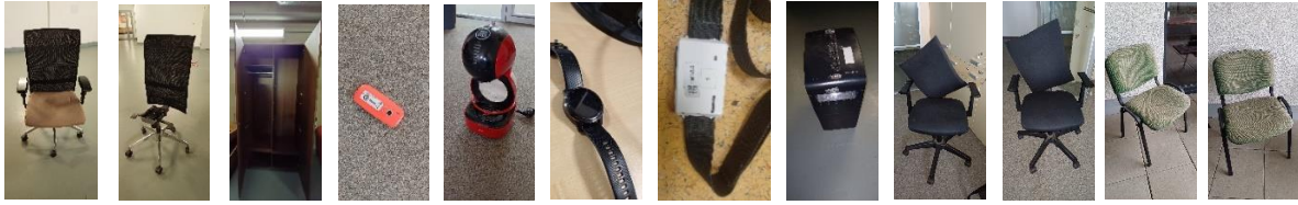
N00002508 N00002512 N00004187 D48220000 D49970000 D53750000 D53780000 D31940000 D36020000 D13550000 D17530000 D17870000