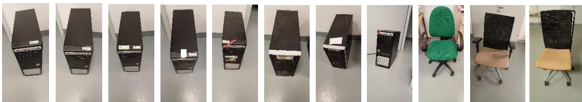
D00003726 D38070000 D00003711 D37960000 D00003756 D35040000 D31610000 D33020000 D16200000 N00002463 N00002562