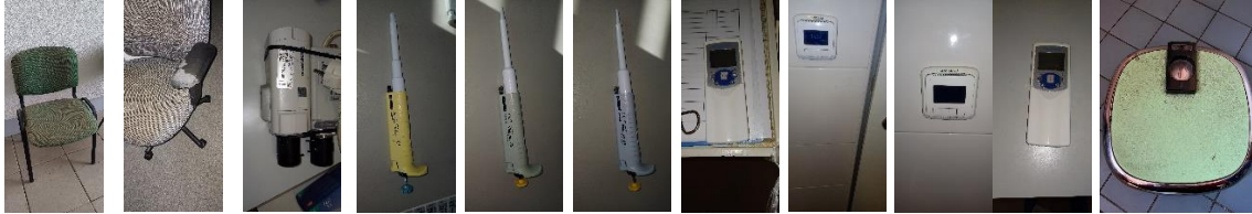
D18070000 D13530000 D33760000 D32960000 D32980000 D33000000 D39490000 D39500000 D39480000 D26240000