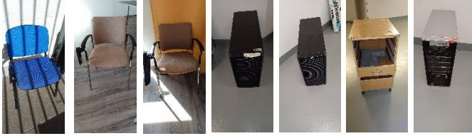
D23470000 N00003475 N00002963 D33520000 D34450000 D14390000 D31230000