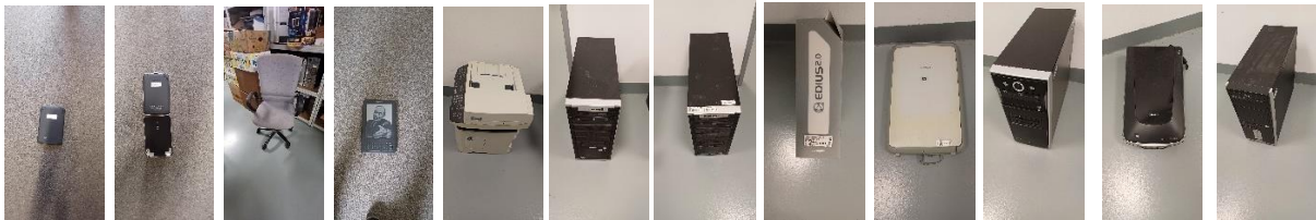
D32790000 D34010000 D36260000 D36130000 D31040000 D31430000 D28630000 D22840000 D25920000 D11410000 D31630000 D31110000