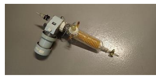
I08460000 Filtrační zařízení zastaralé