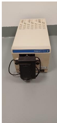
I09660000 Polaroid zastaralý