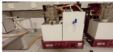
I13110000 Redestilační přístroj zastaralý