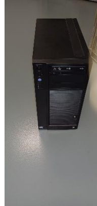
I11340000 Server vadný zdroj