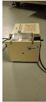
I11620000 Pumpa degas