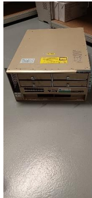
I11940000 Server zastaralý