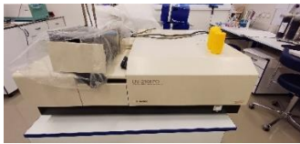
I09220000 Spektrofotometr zastaralý