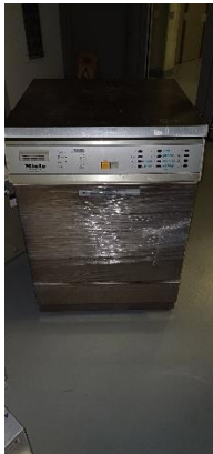
I11470000 Myčka vlnná