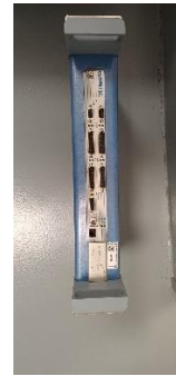
I10520000 Internet SkyWalker