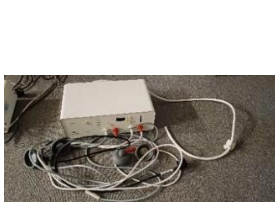
I11240000 Vakuová jednotka nefunkční