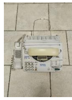
I108600000 Fax zastaralý