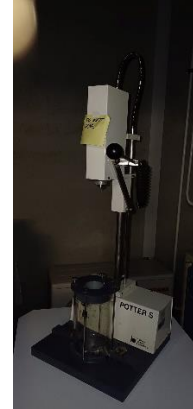
I06410000 Homogenizator zastaralý