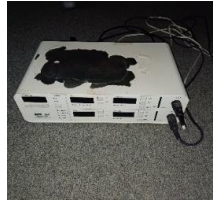
I11220000 Elektroléčebný přístroj