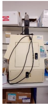
I11600001 Vybavení elektroforézy