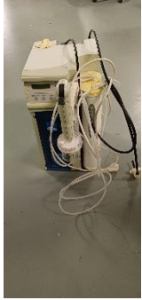
I11380000 Systém na vodu